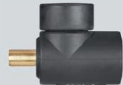
Empalme hembra DIX KAB 70/95