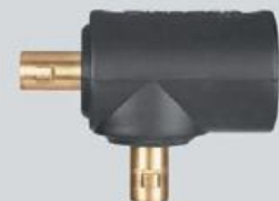
Empalme macho DIX KAS 70/95