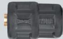
Reducción macho DIX RSS 95/120